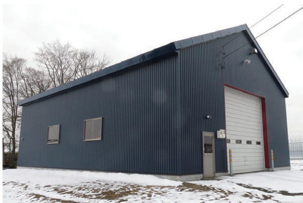
▲ 切妻タイプ 妻面10.8m×桁行き18m