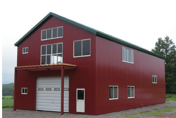
▲ 切妻タイプ 妻面10.8m×桁行き18m