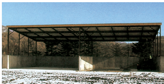
▶ FRタイプ 妻面9m×桁行き18m