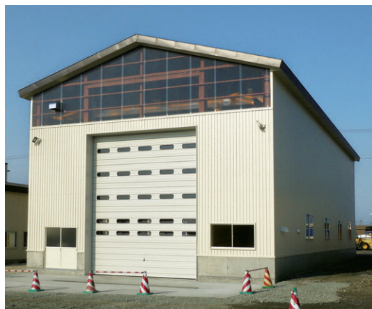
▲ 切妻タイプ 妻面10.8m×桁行き25.2m