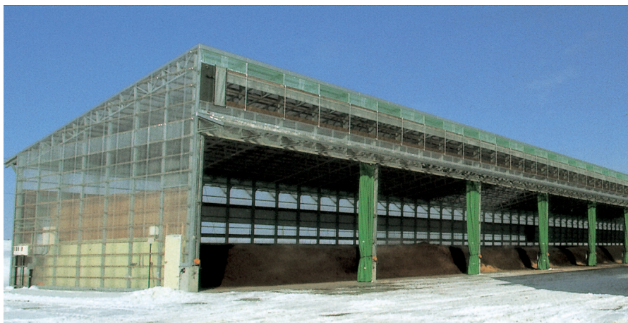
◀ 片流れタイプ 妻面12.6m×桁行き99m