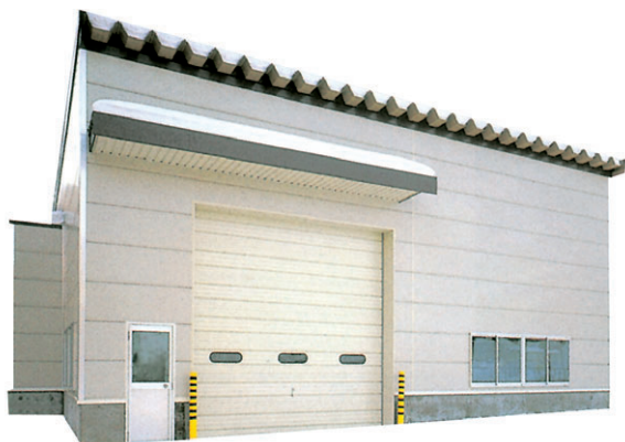
▲ FRタイプ 妻面12.6m×桁行き21.6m