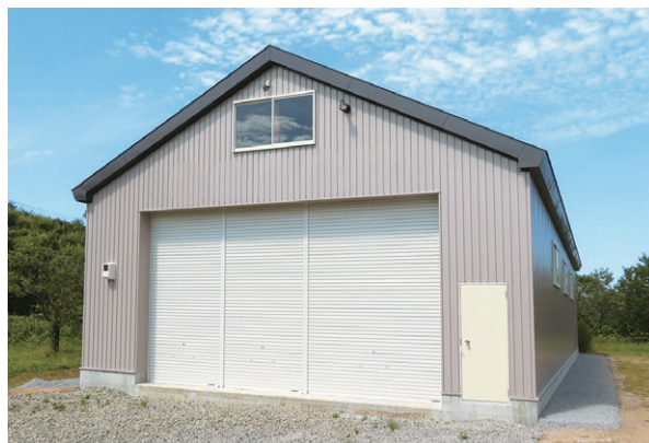
▲ 切妻タイプ 妻面10.8m×桁行き18m