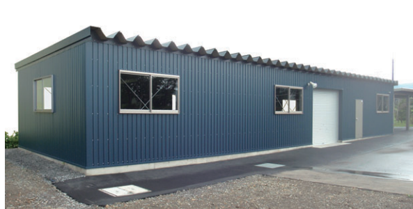
▲ 片流れタイプ 妻面6m×桁行き18m