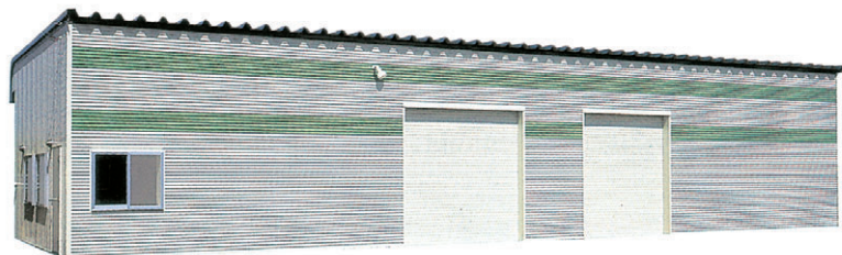
▼ FRタイプ 妻面7.2m×桁行き18m