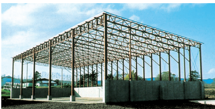
▶ 片流れタイプ 妻面12.6m×桁行き35.6m