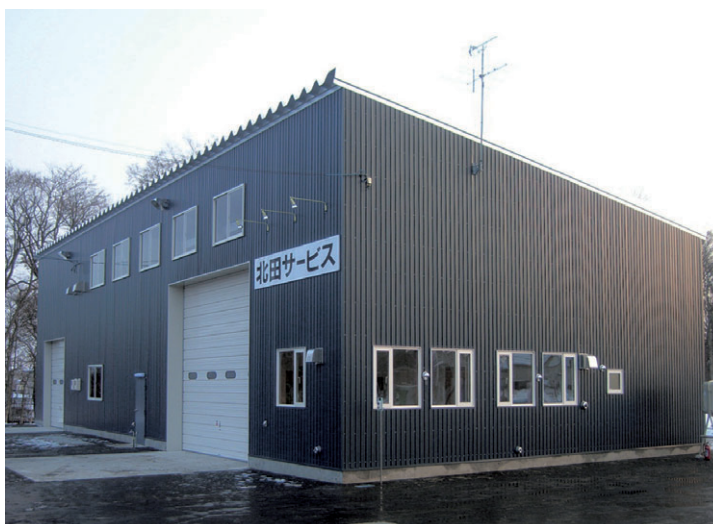
▲ 片流れタイプ 妻面12m×桁行き26.3m