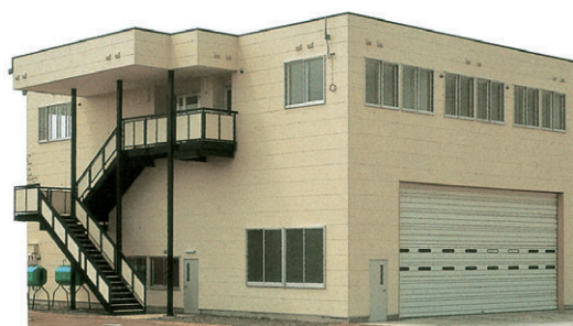
▲ FRタイプ 妻面18m×桁行き12m