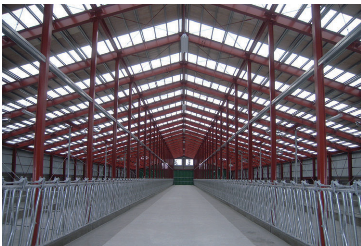
◀ 切妻タイプ 妻面23m×桁行き74m