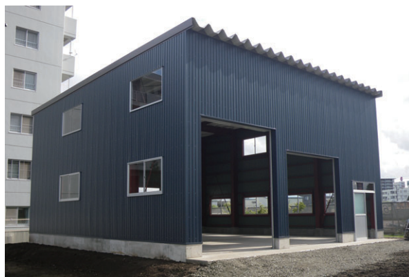
▲ 片流れタイプ 妻面10m×桁行き10.8m