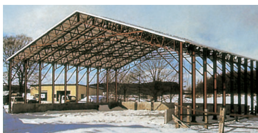
▶ 切妻タイプ 妻面12.6m×桁行き35.6m