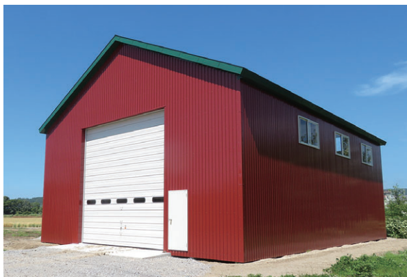
▲ 切妻タイプ 妻面10.8m×桁行き18m