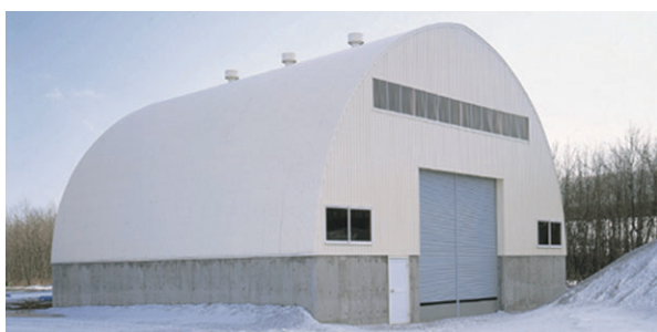
▲ EDタイプ 妻面12.6m×桁行き25.2m