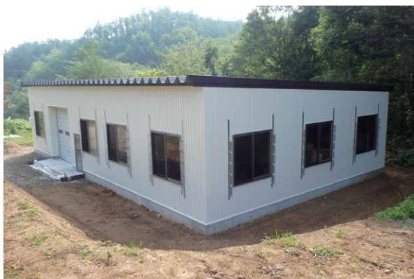
▲ FRタイプ 妻面10.8m×桁行き18m