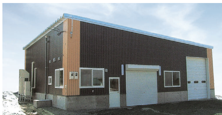
▲ 片流れタイプ 妻面17.4m×桁行き19.2m